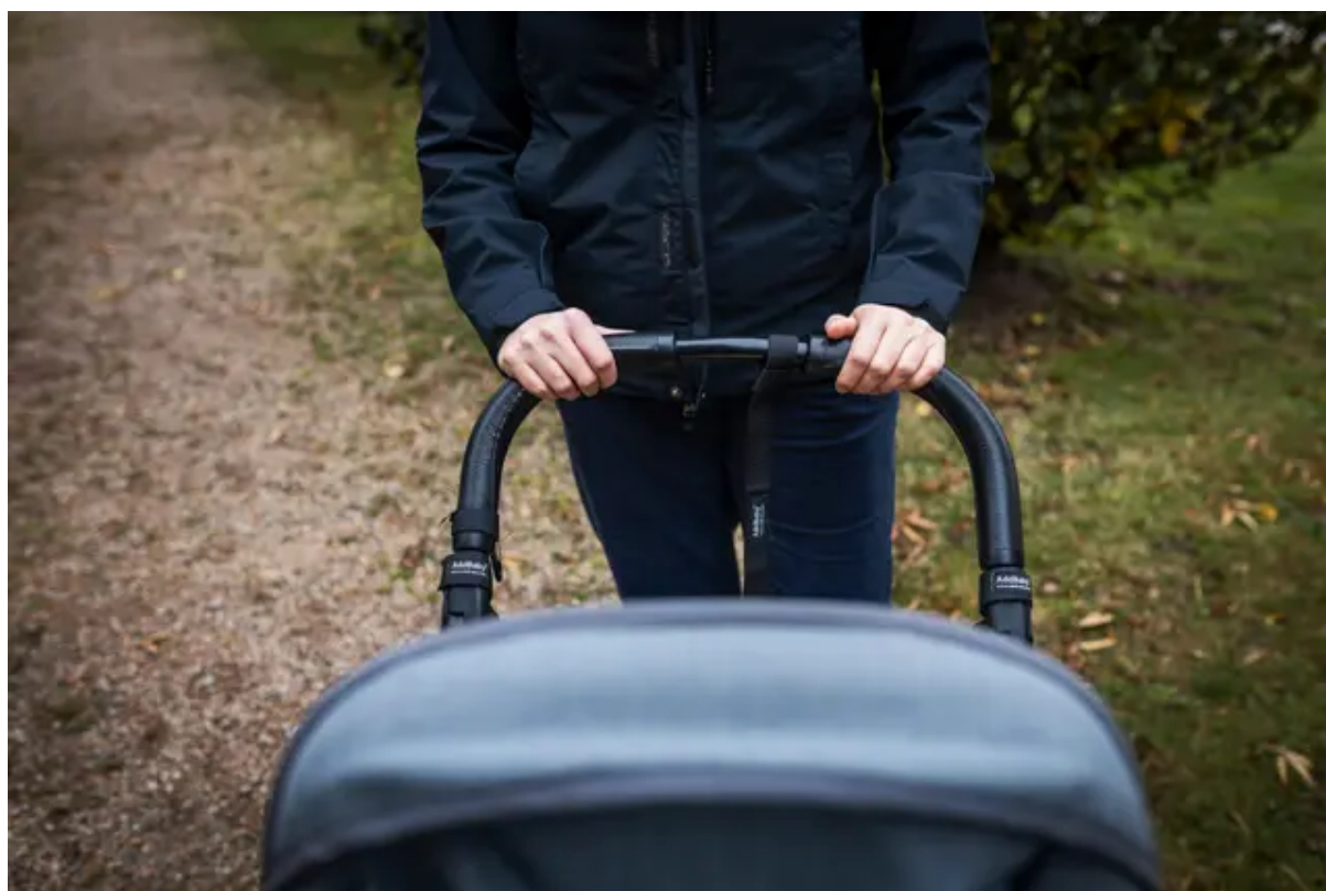
”Min längtan efter barn drev mig dit”, säger Malin.

Ryssland hade portats från det internationella betalningssystemet Swift så det gick inte att betala med kort. I stället fick hon resa med mer kontanter än tillåtet. Även om den största notan, 180 000 kronor till kliniken, kunde ordnas via ett amerikanskt bolag.